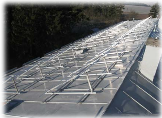
příprava konstrukcí kolektorů z Al profilů