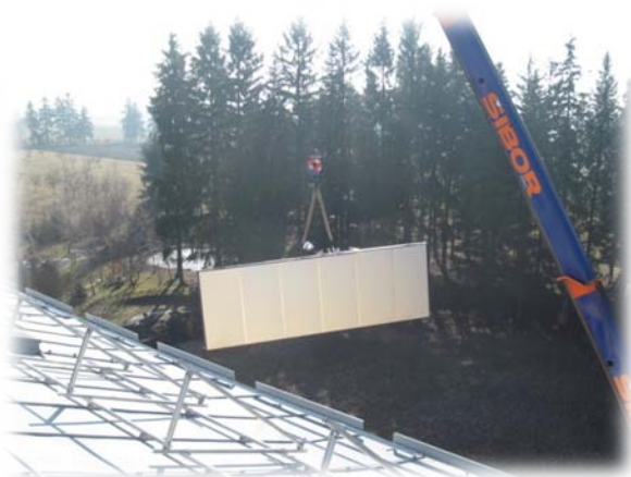
usazení kolektorů na konstrukci-rychlé, bezpečné