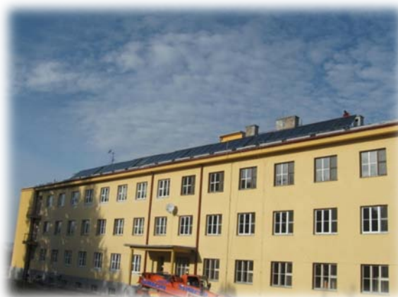
pohled na kolektorové pole