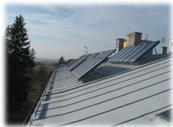
pohled na kolektorové pole