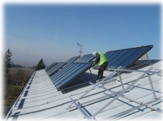
upevnění kolektorů na konstrukci