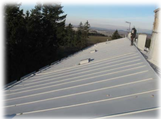
střecha objektu z falcovaného plechu